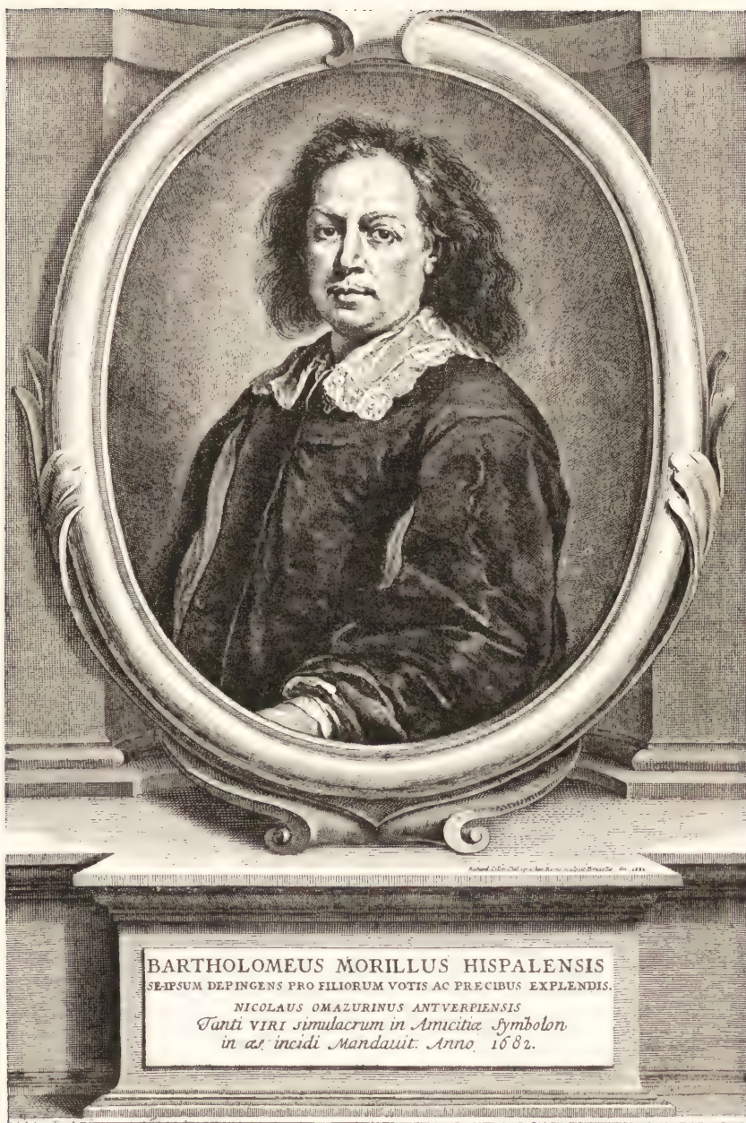
POITRAIT DE MURILLO. D'après la gravure de Richard COLLIN.